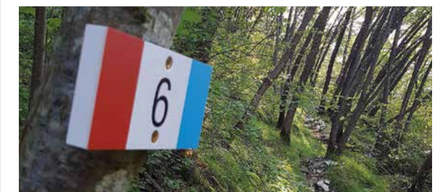
TABELLA SEGNAVIA ORIZZONTALE CHAIRWAY TABLE HORIZONTAL